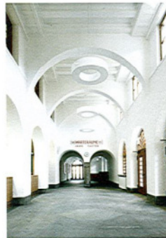
^ In der zweigeschossigen Halle werden wieder wie einst Billette verkauft.