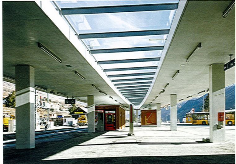
^ Das neue Perrondach schützt die Reisenden von Bahn und Bus vor Wind und Wetter.