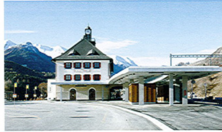
◀ Das Aufnahmegebäude des Bahnhofs Scuol-Tarasp erhielt seine ursprüngliche Farbigkeit zurück und ein neues Dach als Ergänzung.